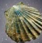
カガミホウテカイ