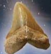
カルカロトコ・メガロトコ