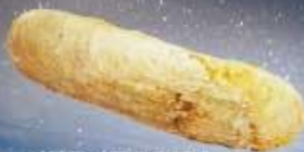
イソム/アシタカイ