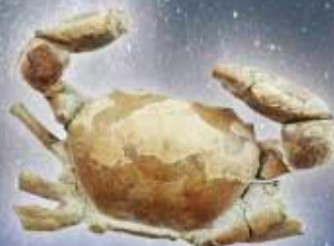
ムカシエビコウガニ