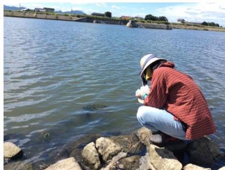
平田船川における調査風景(左:投網による捕獲調査、右:環境 DNA 用の採水作業)