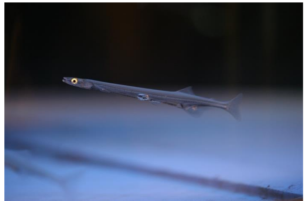
本研究の対象魚 2 種(左:ワカサギ、右:シラウオ)